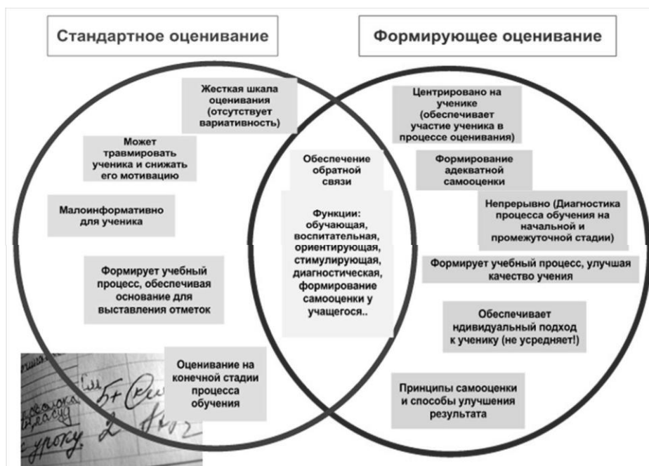
Рис. 1. Схема отличия формирующего оценивания от стандартного

Сегодня педагоги гимназии не только адаптировали предложенные автором методики под свой образовательный процесс, но и совершили попытку их усовершенствования и создания своих инструментов оценки процесса формирования и уровня достижения индивидуальных образовательных результатов обучающимися.