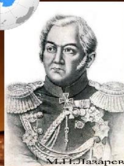
М. П. Лазарев