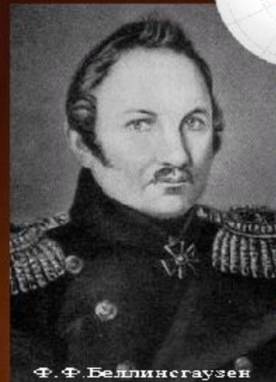
Ф. Ф. Беллинсгаузен