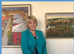
Экскурсии - художники