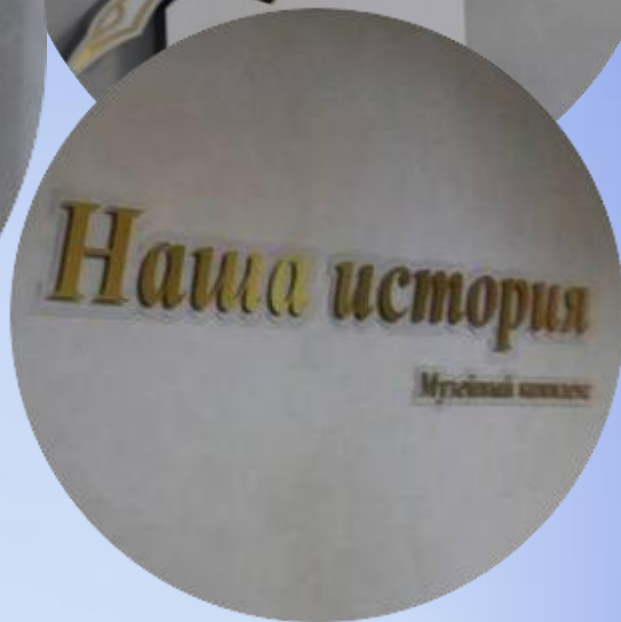
Музей истории школы