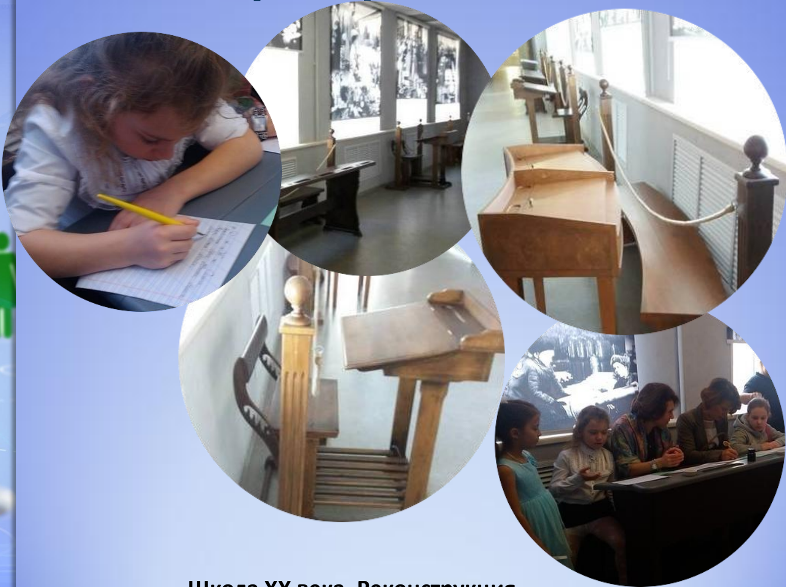
Школа XX века. Реконструкция