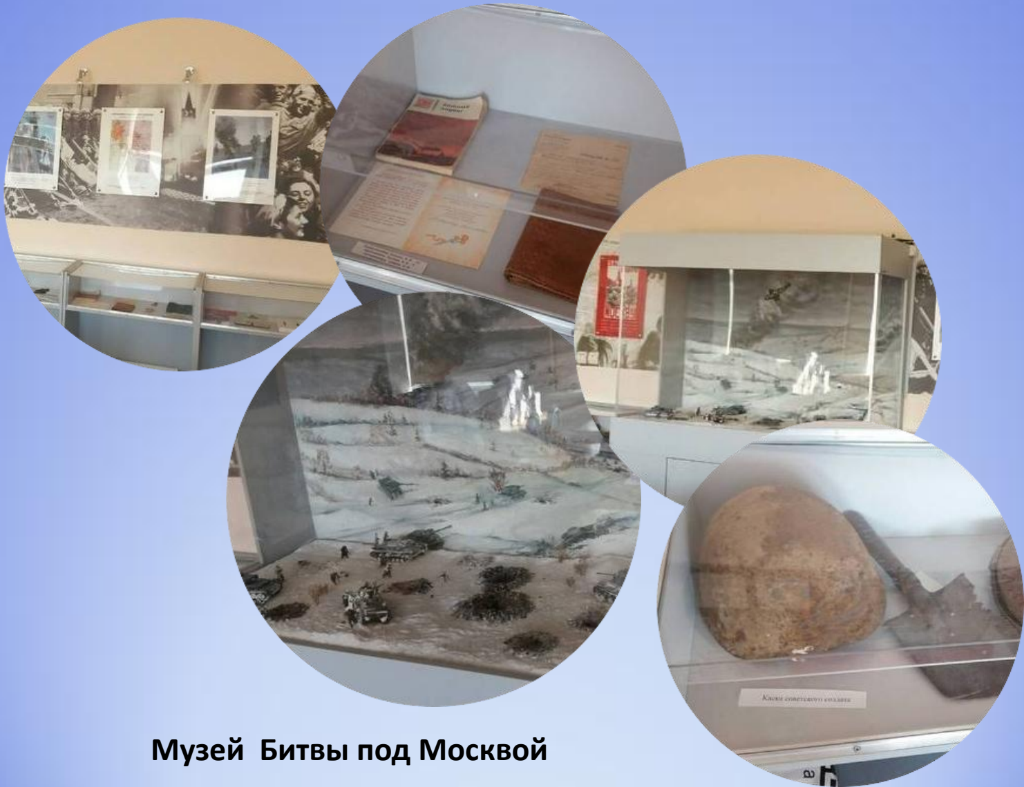
Музей Битвы под Москвой